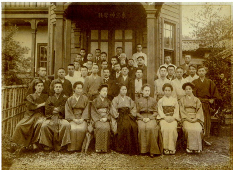
東京神学社の卒業式(年代不詳)